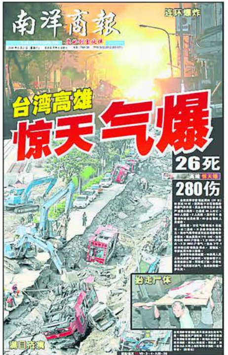
台湾高雄于2014年8月1日凌晨发生的气爆事故引发悲剧，《南洋商报》当天的封面以“台湾高雄惊天气爆”为题图文并茂说明现场真实状况，这排版也为本报赢得2014年丹斯里刘天成年度封面奖优胜奖。

此外，卜亚烈促请国家领袖在厘清一个马来西亚发展有限公司（1MDB）事件前，不能耽误国内其他重大课题，需以果断和坚决态度处理和解决难关。