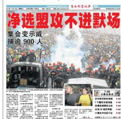
本报凭《净选盟攻不进默场》夺得首次颁发的丹斯里刘天成年度封面奖；摄影记者陈凯强也同时凭这张照片夺下拿督陈良民摄影奖优胜奖。