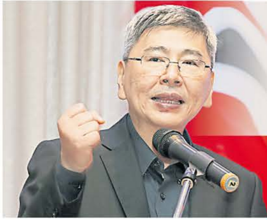
馬袖強勉勵新聞從業員在報導新聞時對事不對人，並據實報導。