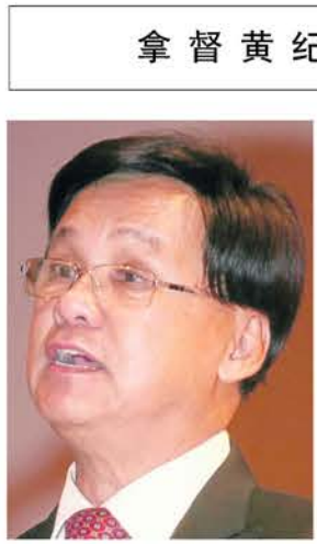
方天兴：政府应尊重媒体的力量和言论自由。

（八打灵再也15日讯）华总会长丹斯里方天兴指出，华文报章建立客观、负责、中立、自律、权威及公信力，即使面对一系列挑战，仍拥有极大的生存与发展空间。 他说，华文报章以理性和自制，在不影响本身族群，并尊重和包容其他族群权益的立场下处事，这种顾全大局的手法让人苟同及赞赏。 维护华社整体权益 “在我国的多元国情，甚至不时出现的‘多元情绪’下，华文报在处理有关诸如涉及种族和宗教敏感的新闻或报道上，都会顾及各方面有关方面的感受。” 方天兴周五晚出席马来西亚华文报刊编辑